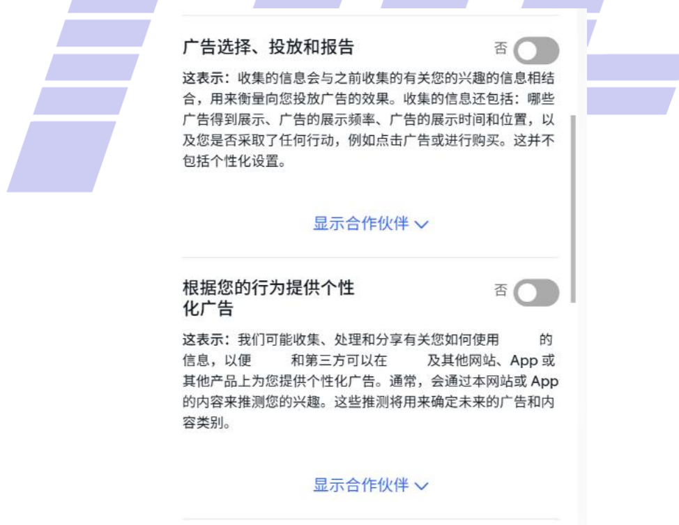
图 A.2 电商购物类应用定向推送关闭功能示例

如图A.2所示，该电商购物类应用提供了“根据您的行为提供个性化广告”的开关按钮，用户可以根据需要关闭相应的定向推送。同时，提供了“显示合作伙伴”功能，显示了应用提供个性化广告时合作的第三方。