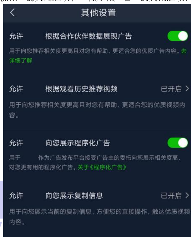
图 A.3 影音娱乐类应用定向推送关闭功能示例

如图A.3所示，该影音娱乐类应用会通过第三方合作伙伴获取用户在第三方合作伙伴平台的一些用户信息，用于定向推送，因此该应用提供了“允许应用根据合作伙伴数据展示广告”的开关按钮。此外，还提供了“根据历史推荐视频”的关闭选项和“程序化广告”的关闭选项。